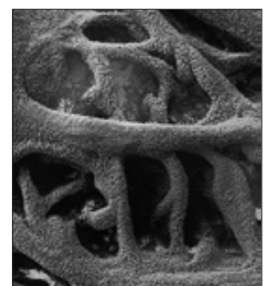
Fotografía microscópica. M.G.