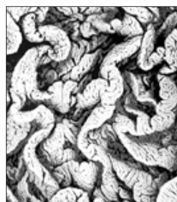
Imagen de la muestra. M.G.