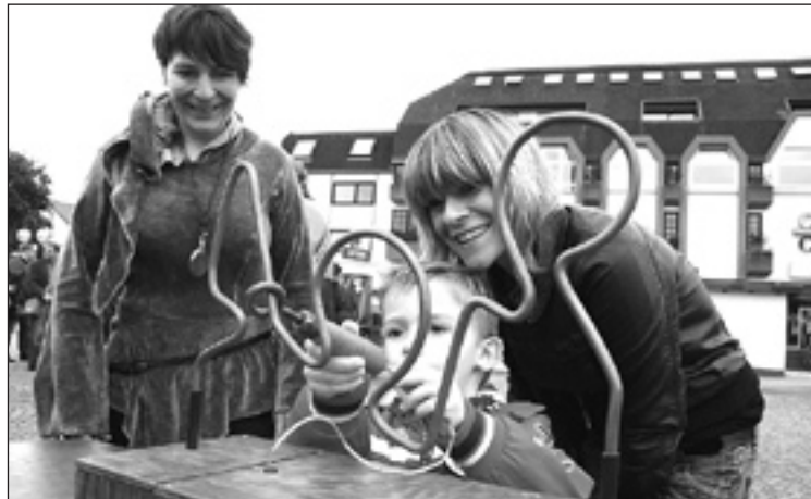
El público contempló los inventos con sorpresa e interés. S.E.

sonas del público (sin peligro alguno) y sobre el que el mago, apoyado en una pequeña plataforma, ejecuta "el prestigio final", el remate que deja el mejor sabor de boca. "Recibimos muy buenas críticas del jurado. Nos dijeron que podíamos ir a cualquier festival del mundo con esta creación, pues el vehículo les pareció muy original, y también el personaje y el guión bien hilado. Y lo del público fue todavía mejor. Muchas personas, impresionadas por el último efecto, pedían el primer premio para nosotros", explica el mago.